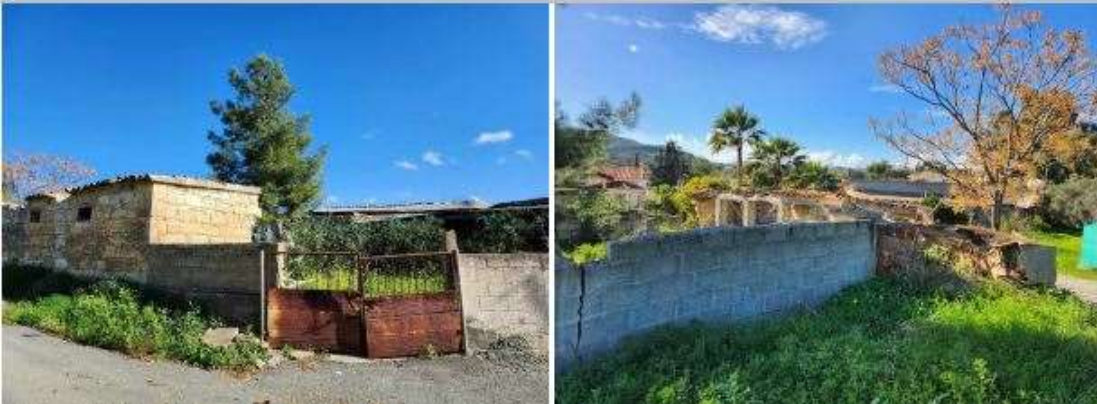
SHEET XXXIX PLAN 64